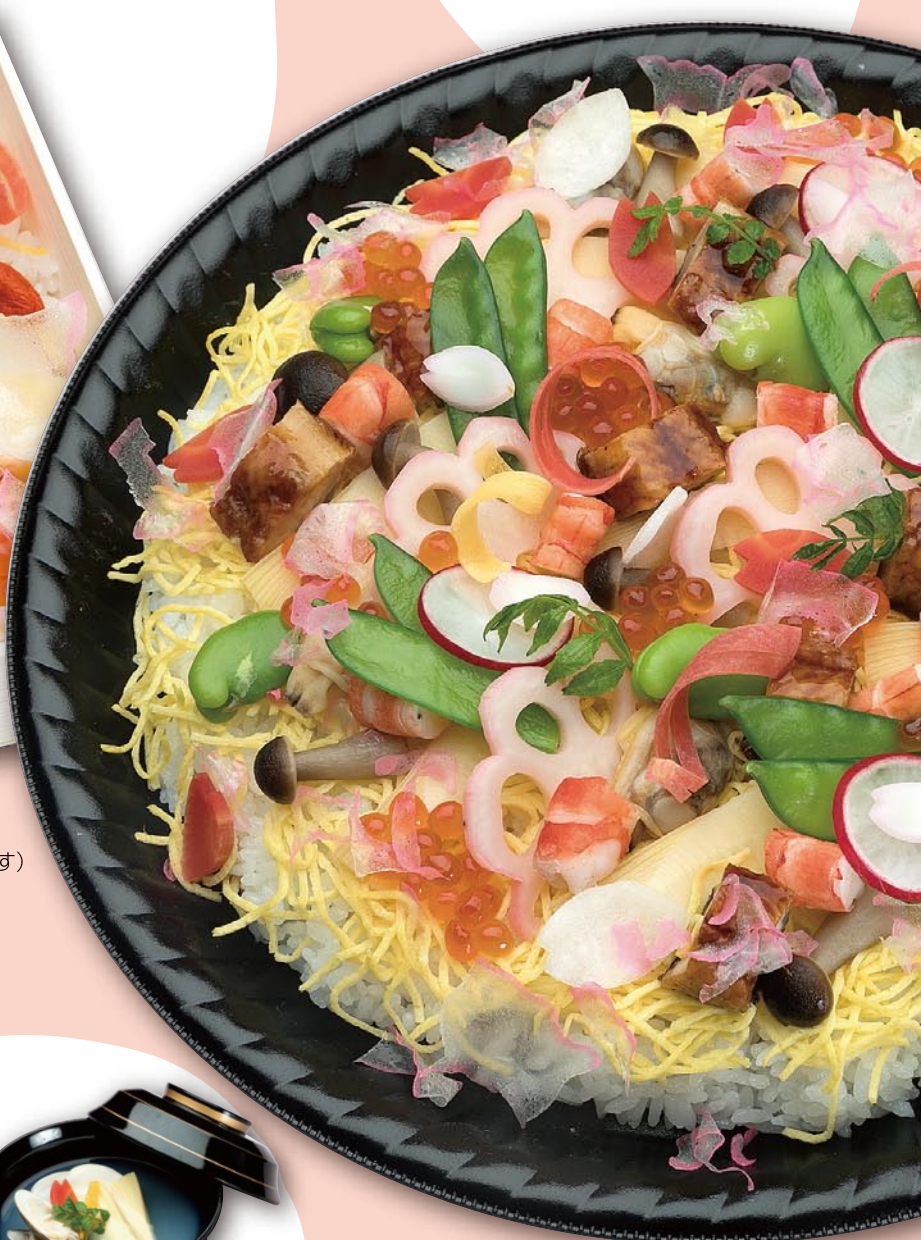
▲ちらし大皿 (写真はイメージです)