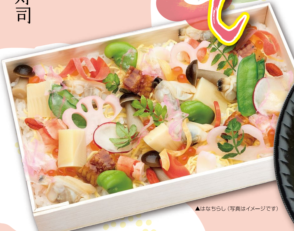
▲はなちらし (写真はイメージです)