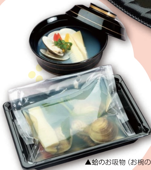
▲蛤のお吸物 (お椀の写真はイメージです)

いかがですか♡ 甘酒 (ノンアルコール) 1パック 130g 300円 324円(税込)